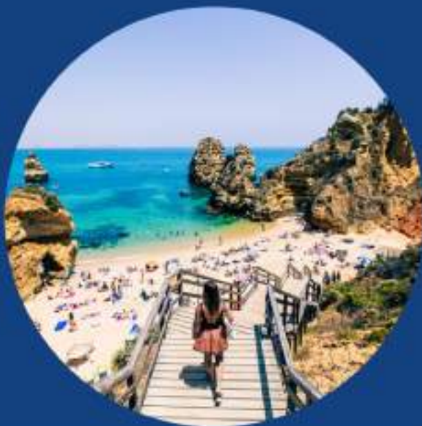
Fotos de la Bahía: LA VAI NANÁ - ALGARVE PORTUGAL

Este curso es la mejor inversión en el futuro de todo profesional. Aquí, los participantes desarrollarán las habilidades y confianza para sobresalir en un campo en constante evolución.